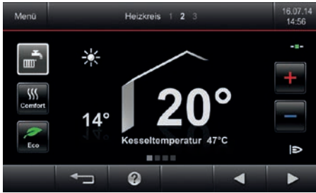
Renkli dokunmatik ekranlı Vitotronic 200 kontrol paneli