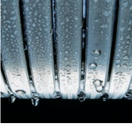
Inox-Radial ısıtma yüzeyi – uzun ömürlü ve yüksek verimli

Vitodens 222-F gaz yakıtlı kompakt yoğuşmalı kazan, emaye kaplı depo boyleri ve renkli dokunmatik ekranı sayesinde yüksek sıcak su ve kullanım konforu sunmaktadır.